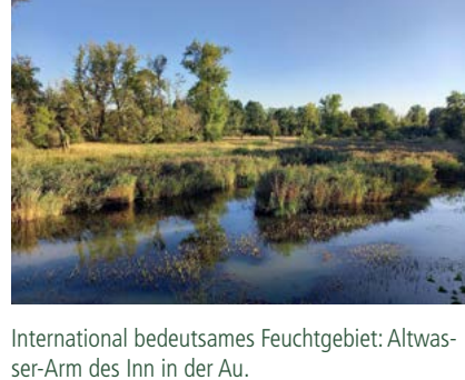
International bedeutsames Feuchtgebiet: Altwassers-Arm des Inn in der Au.

Dauer: ca. 2 Stunden, Teilnahmegebühr: 3 € (Kinder frei) Treffpunkt: Parkplatz an der Kirche in Seibersdorf, von dort Weiterfahrt ins Gelände