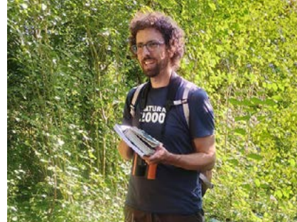
Der „Vogelphilipp“ in der Eringer Au.