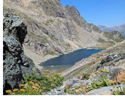
Lunghinsee Maloja Schweiz – Ausbildung Inn-Guides.

Der Landkreiskalender 2026 entstand diesmal durch einen Fotowettbewerb des Naturium unter dem Motto „Vogelwelt am Europareservat Unterer Inn“. Es sind noch kostenlose Exemplare des Kalenders im Naturium sowie im Landratsamt in Pfarrkirchen erhältlich.