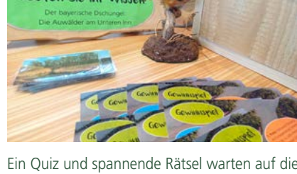
Ein Quiz und spannende Rätsel warten auf die Besucher der Messe.

Es gibt auch, wie jedes Jahr, ein spannendes Gewinnspiel, bei dem interessante Führungen durch die Natur am Europareservat Unterer Inn zu gewinnen sind. Zu finden sind wir in Halle A5 am Stand 611 des Landkreises Rottal-Inn.