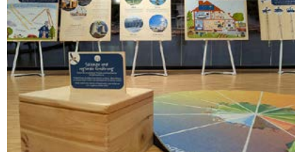
Landkreis-Ausstellung Klima-Kinder.