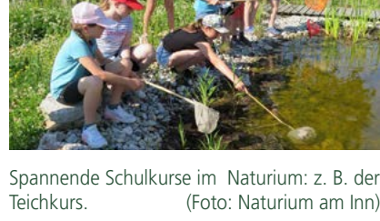
Spannende Schulkurse im Naturium: z. B. der Teichkurs.

Weitere Infos und die Möglichkeit zur Online-Bewerbung findest du hier auf dem Karriereportal des Landkreises Rottal-Inn.