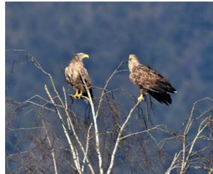
Seeadler-Paar