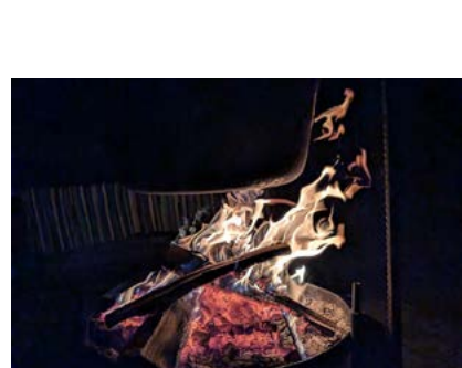
Ein knisterndes Holzfeuer erhitzte den Glühpunsch im Kessel.

Das Naturium-Team hat sich gefreut, dass das Angebot so gut angenommen wurde. Deshalb wird es sicherlich auch im nächsten Jahr wieder einen Lichterweg durch die Eringer Au geben.