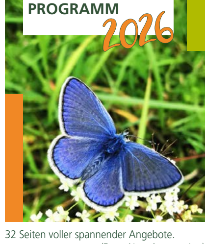
32 Seiten voller spannender Angebote.

Die Anmeldung ist ganz einfach per E-Mail: naturium@rottal-inn.de , per Telefon: 0049 8573 1360 oder für die Angebote des Veranstaltungsprogramms online über unser Buchungsportal auf unserer Website www.naturium-am-inn.de möglich.