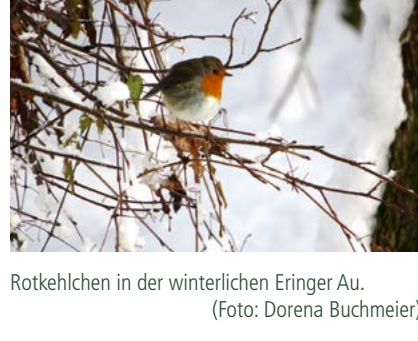
Rotkehlchen in der winterlichen Eringer Au.

Dauer: ca. 2 Stunden, Teilnahmegebühr: 3 € (Kinder Ering) Treffpunkt: Naturium am Inn, Innebergstr. 15, 94140 Ering