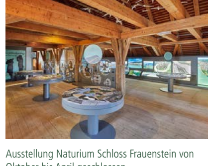
Ausstellung Naturium Schloss Frauenstein von Oktober bis April geschlossen.

Sonderöffnungszeiten der Burgschänke werden auf der Webseite der Burgschänke Frauenstein unter www.burg-frauenstein.com gegeben.