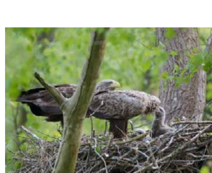
Seeadler mit Küken im Adler-Horst.