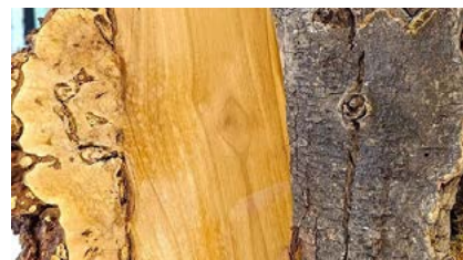
Verschiedene Holzarten zur Ansicht: Rinde, roh, gehobelt.

Eine Anmeldung ist nicht erforderlich – der Eintritt ist frei.